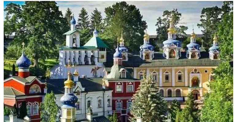
Псково-Печерский монастырь основан в 1473 г.