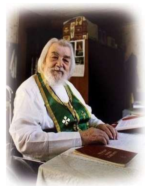
Архимандрит ИОАНН (Крестьянкин)

«Храните любовь к своим родителям, учителям и наставникам, любите родные места, а с ними и свою Родину – нашу Россию, ее святыни и культуру» Псково-Печерский монастырь