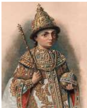
Петр I в детстве

богослов, духовный писатель, стихотворец, деятель культуры XVII века