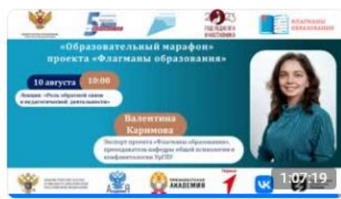
Лекция: «Обратная связь в образовательной среде»