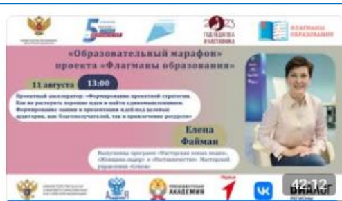
Проектный акселератор: «Формирование проектной стратегии...» Флагманы образования ✓ 799 просмотров · 18 дней назад