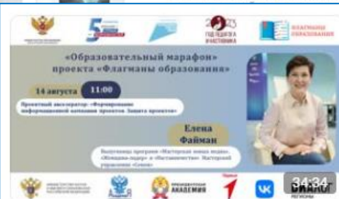
Проектный акселератор: «Формирование информационной...» Флагманы образования ✓ 838 просмотров · 15 дней назад