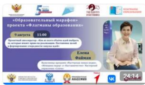
Проектный акселератор: «Как из всего объема идей выбрать те, которые име...